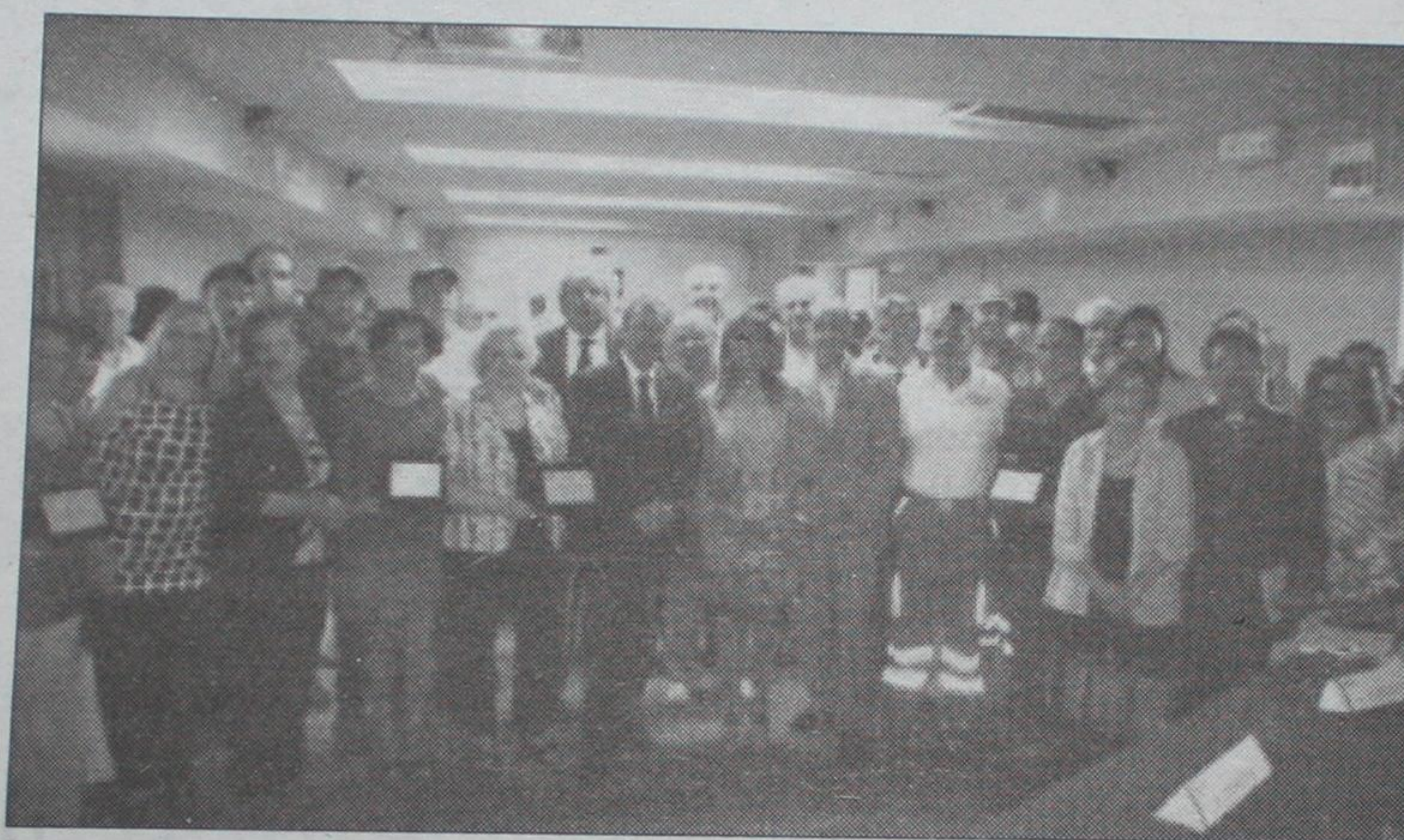
Il riconoscimento pubblico alle associazioni di volontariato che operano tra le corsie dell'ospedale

DA angeli invisibili di corsia a protagonisti di una bella pagina di riconoscenza. Sono stati loro, i volontari delle associazioni che operano nel nosocomio e partecipano all'importante compito di assistenza ai pazienti, i personaggi principali dell'appuntamento voluto dall'Azienda Ospedaliera "Pugliese-Ciaccio" di Catanzaro e tenuto questa mattina presso la biblioteca del Presidio di Viale Pio X.